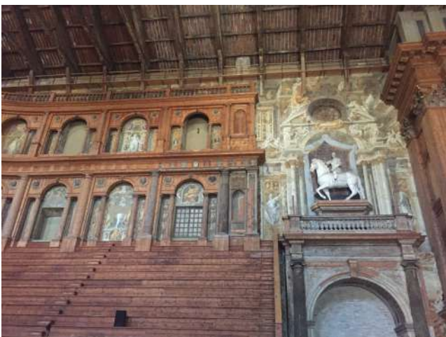
Il Teatro Farnese