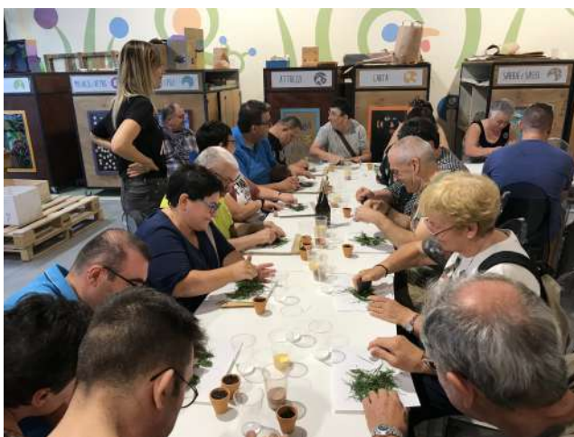
Laboratorio di disegno con l'erba