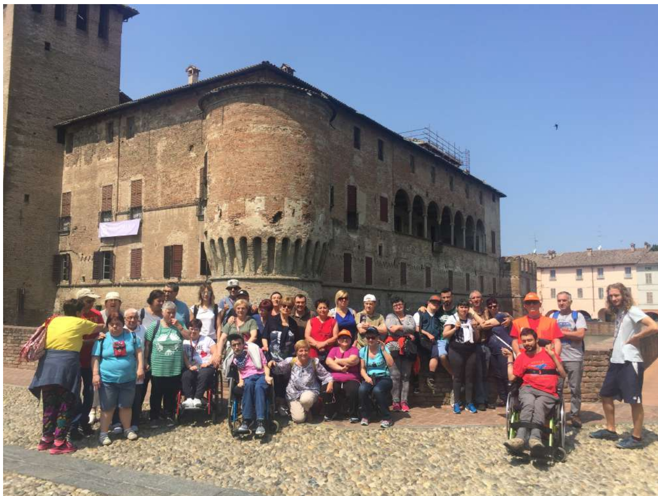
Foto di gruppo davanti al Castello di Fontanellato.