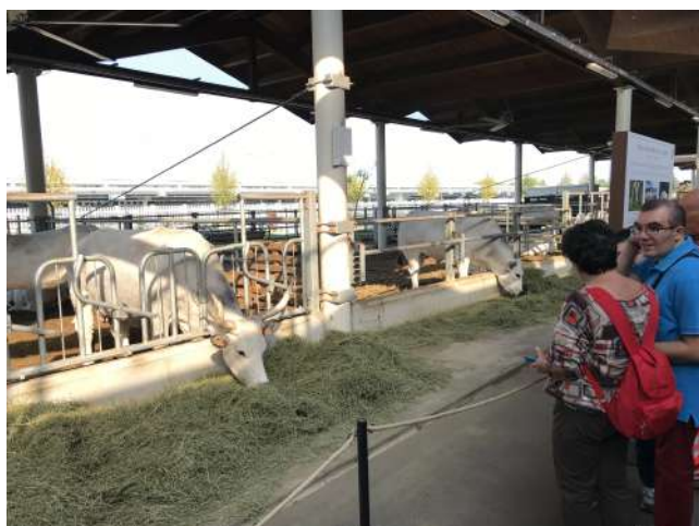
Le stalle di FICO

Bisogna che ci torniamo ad esempio per vedere tutta la parte dedicata alle aziende che fabbricano i vari tipi di alimenti.