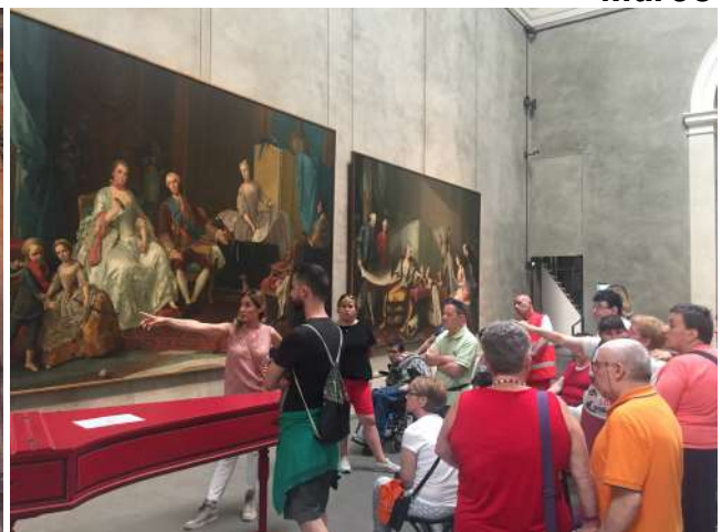
La Galleria Nazionale