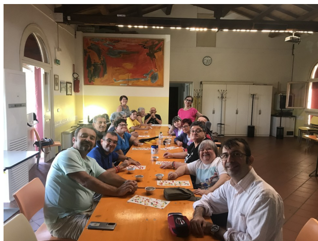
Tombola al Centro Pertini