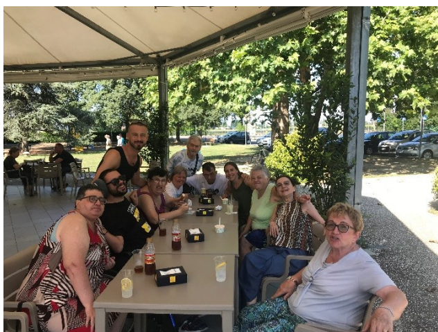
In gelateria la scorsa estate