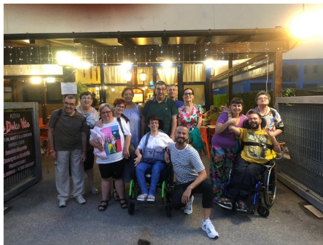
La pizza compleanni