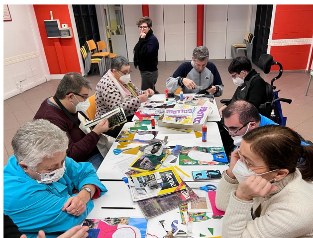
Collage al laboratorio di Arteterapia